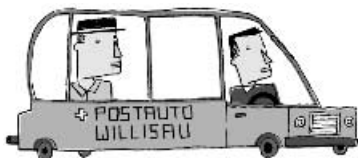
Dann nichts wie los nach Willisau! Mit Zug und Bus geht das gut.

Die Fidel ist viel einfacher zu spielen, ein Erfolgserlebnis ist Ihnen sicher!