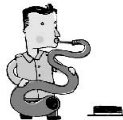
Ob aus dieser Schlange wohl Töne schleichen?